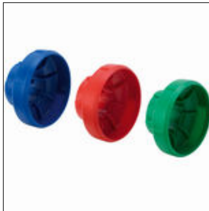
Fig. 4: Modell 2275.97 Easytop-mediamerking