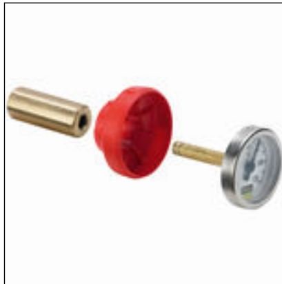
Fig. 3: Modell 2275.94 Easytop-termometer