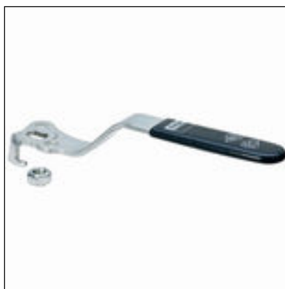
Fig. 1: Modell 2275.93 Easytop-betjeningshendel L-form