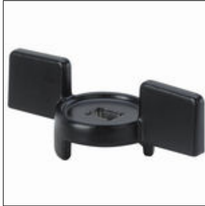
Fig. 2: Modell 2275.92 Easytop-betjeningshendel T-form