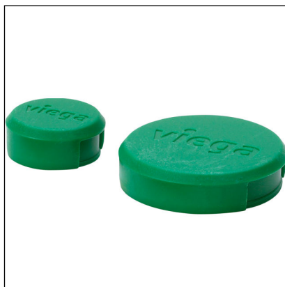
Fig. 5: Modell 2275.96 Easytop-beskyttelseskappe grønn