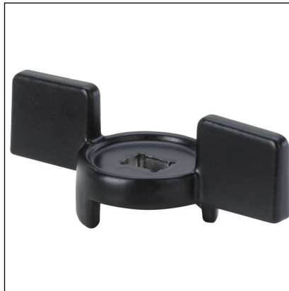
Fig. 2: Modell 2275.92 Easytop-betjeningshendel T-form