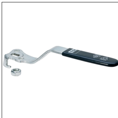
Fig. 1: Modell 2275.93 Easytop-betjeningshendel L-form