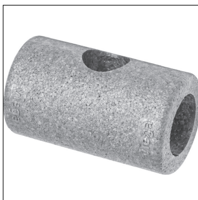
Fig. 6: Modell 2275.90 Easytop-isolerende skall

Isolerende EPS-skall kan leveres for alle kuleventilstørrelser. De todelte skallene er selvholdende og monteres uten verktøy og festeklemmer. De ligger sømløst an mot frontflatene til rørledningsisolasjonen.