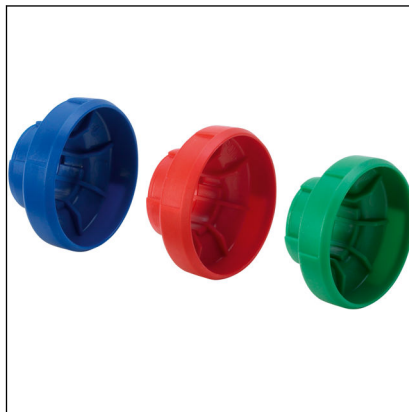
Fig. 4: Modell 2275.97 Easytop-mediamerking