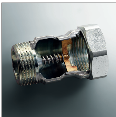
Slika 2: Primjer aktiviranog termičkog zapornog uređaja (TAE)

Brtnveni konus je prednapregnut oprugom i drži se u položaju uz pomoć taljivog uložka izrađenog od lema. Lem se topi pri temperaturi > 96\text{ °C} . Opruga se rasterećuje i pritišće čunjasti ventil u protočni otvor. Time je protok plina zapriječen, a ventil trajno plinonepropusno zatvoren.