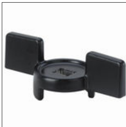
Fig. 2: Modèle 2275.92 levier de commande Easytop en T