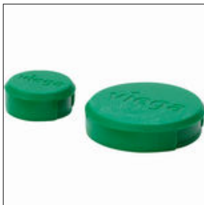
Fig. 5: Modèle 2275.96 coiffe de protection Easytop verte