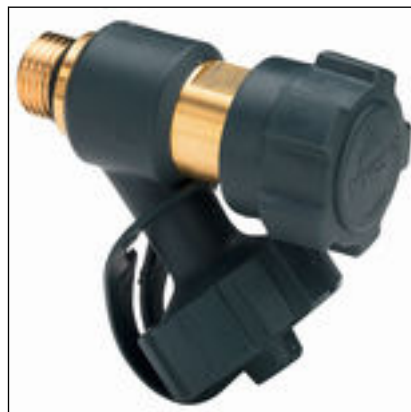
Fig. 6: Modèle 2234 vanne de vidange Easytop