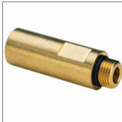
Fig. 5: Modèle 2234.5 prolongement Easytop