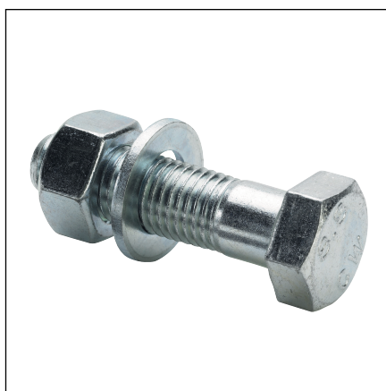
Fig. 3: Model 2259.7 / XL monteringssæt