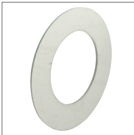
Obr. 4: model 2259.9 / těsnění XL