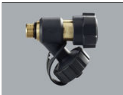
Obr. 2: model 2234 vypouštěcí ventil Easytop se závitovým přípojem G ¼